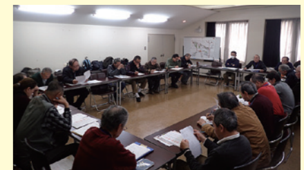
飛鳥里山クラブの方針を決める会議