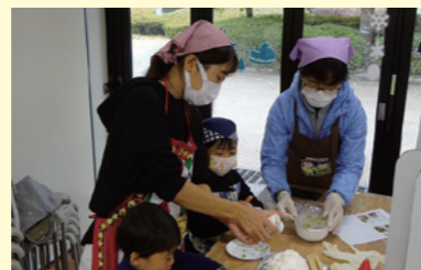
イベントで子供たちとふれあう

国営飛鳥歴史公園の魅力を発信するため、公園イベントへの協力や運営補助、甘樫丘での里山保全活動、公園利用サービス、これらを行っていくための組織運営を会員みんなで協力して行っています。